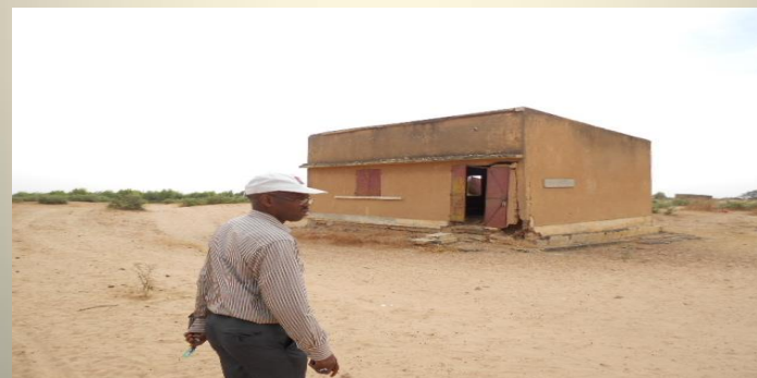
Uno de los edificios de la escuela de Mbambara Sherif

La escuela primaria de Mbambara Sherif que polariza a ocho aldeas más está en situación de casi ruina y si se derrumbe, cada familia tendría que pagar cinco euros por niño por día para que puedan ir a la escuela del pueblo más cercano, lo que dificultara todo esfuerzo de desarrollo que se llevara a cabo en esta zona.