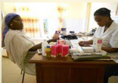
Centro de Salud de SOM (Thiés)

La ciudad de Thiés se encuentra a 75 kilómetros de Dakar (Capital de Senegal) y las actividades que llevaremos allí se harán en la comùn de Thiés -oeste y tendrán como objetivo un mejor conocimiento de la situación socioeconómica y sanitaria de un grupo de barrios que constituyen una verdadera bolsa de pobreza que, a pesar de su aparente tranquilidad tienen la mayor parte de sus poblaciones que no pueden permitirse tres comidas al día, con un grave problema sanitario ya que su centro de salud, como la mayor parte de los centros de salud de Senegal está mal equipado y su personal tiene un déficit de formación, lo que provoca mucha veces incidentes lamentables .